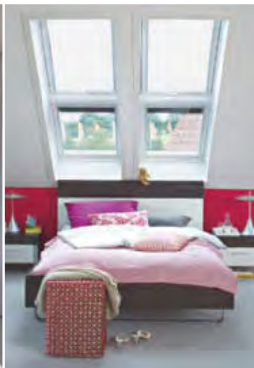
Schlafplatz: Ein wahres Himmelbett.