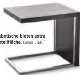
Einschiebetische bieten extra Abstellfläche. Koinor „Task“

Die Bezeichnung deutet an: Polstermöbel müssen gut gepolstert sein. Und sie müssen ausreichend Fläche bieten zum gemütlichen Ausstrecken, aber auch genügend Halt. Das Motto: weiche Schale, harter Kern. So richtig bequem wird's, wenn komfortable Extras sämtlichen Ansprüchen ans Sitzen und Liegen gerecht werden. Hochwertige moderne Modelle sind da wahre Bewegungskünstler.