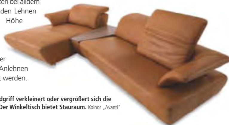
Mit einem Handgriff verkleinert oder vergrößert sich die Sitztiefe. Der Winkeltisch bietet Stauraum. Koinor „Avanti“

Multifunktionale Sitzgelegenheiten mit individuell verstellbaren Elementen erleichtern die Suche nach dem perfekten Polstermöbel. Stufenlos regulierbare Arm- und Rückenlehnen, bewegliche und höhenverstellbare Kopfteile oder integrierte Fernsehsessel-Funktionen, bei denen sich die