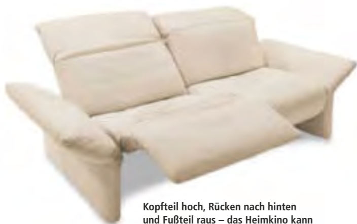
Kopfteil hoch, Rücken nach hinten und Fußteil raus – das Heimkino kann losgehen! Koinor „Elena“

Ein Sofa dient nicht nur zum Sitzen, sondern auch zum Liegen, Lesen oder Fernsehen. Extras wie verstellbare Lehnen erfüllen jeden Komfortwunsch. Das Design kommt dabei nicht zu kurz.