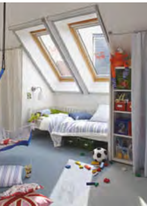
Spielplatz: Schön schräge Räuberhöhle.

Als Studio oder Home-Office ist ein Dachzimmer ebenfalls ideal, denn zum Arbeiten braucht man nicht nur einen kühlen, sondern auch einen hellen Kopf – und gute Aussichten. Wichtig sind aber auch Rollos oder Jalousien, mit denen Sie die Sonne gelegentlich aussperren beziehungsweise den Lichteinfall entsprechend steuern können.