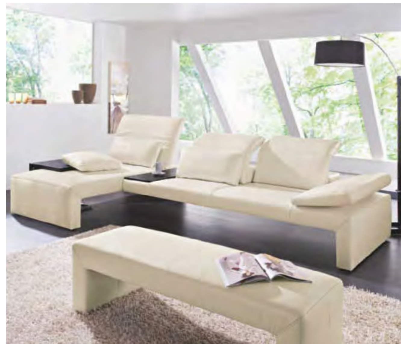
Verstellbare Armteile mit extrabreiten Kissen, variabel in Sitztiefe und Rückenlehnung – dieses Sofa ist besonders anpassungsfähig. Koinor „Acanto“

komplette Sitzneigung verstellen lässt, befördern Sie mühelos in die ideale Entspannungspose. Sogar die Sitztiefe lässt sich bei manchem Modell schnell verändern. Clevere Details wie Einschiebetische oder integrierte Tische mit Stauraum machen Ihnen den Feierabend noch angenehmer. Raffinierte Klappmechanismen verwandeln selbst schlichte Hocker in solide Sitze mit Rückenlehne. Sachliche Designer-Sofas werden mit einem Handgriff zu heimeligen Hochlehnern. An den praktischen Zweisitzer lässt sich problemlos ein Lounge-Chair andocken.