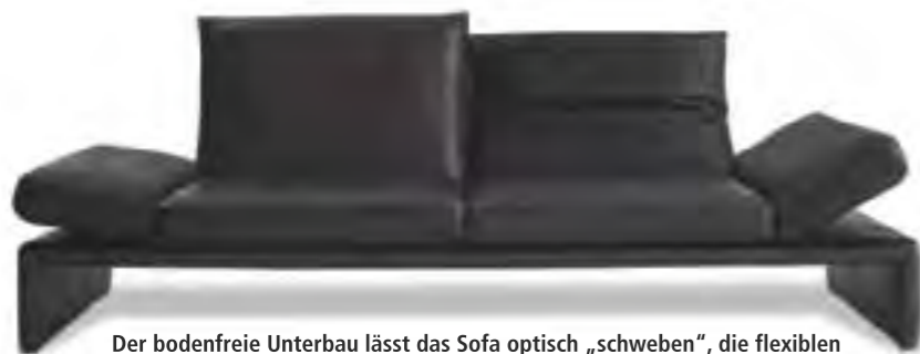
Der bodenfreie Unterbau lässt das Sofa optisch „schweben“, die flexiblen Arm- und Rückenlehnen erlauben viele Sitzpositionen. Koinor „Raoul“